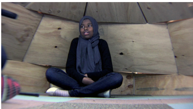
Bygg Rec på Tensta konsthall 2009.

Rörlig bild skapar identitet. Ger röst. En workshop som lär ut cinematografiska grepp och låter ungdomar producera 20-sekundersfilmer om sitt liv enskilt eller i grupp.